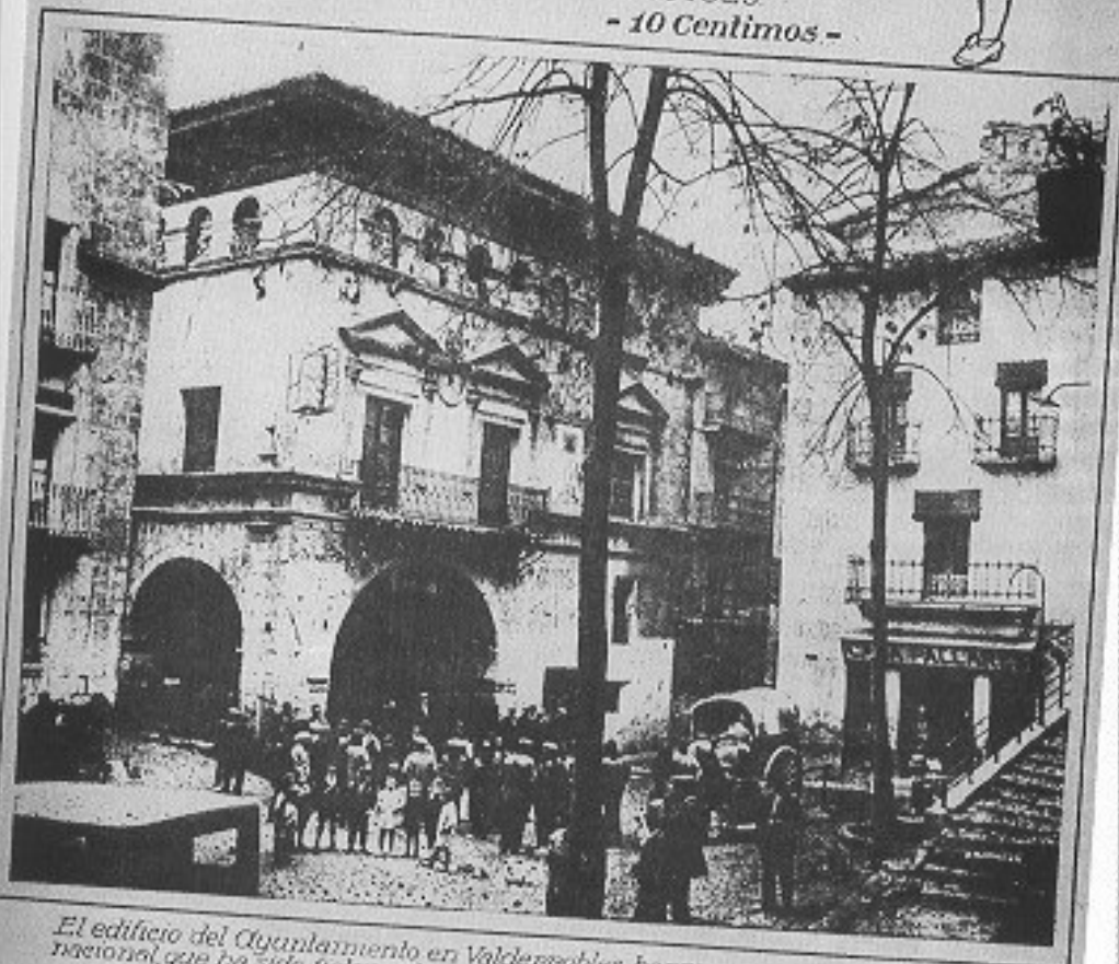
El edificio del Ayuntamiento en Valderrobres, hermosa muestra del arte nacional, que ha sido fielmente reproducido en la plaza mayor del Pueblo Español, de la Exposición.

Nº 2 - Barcelona 28 de Abril de 1929 - 10 Centimos -