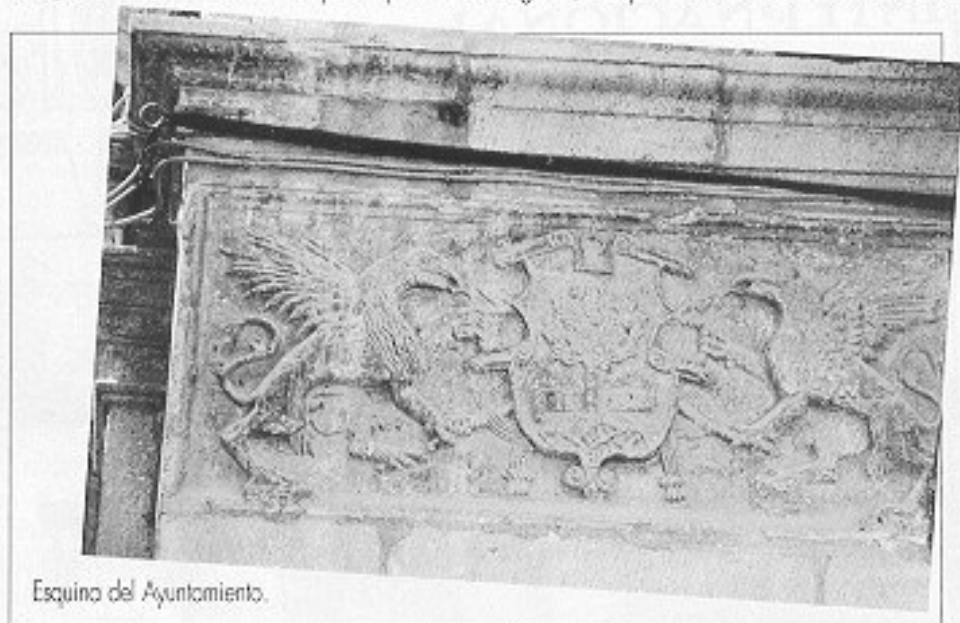
Esquina del Ayuntamiento.

Probablemente el árbol representado en el frontal de los leones del puente simboliza el escudo municipal. Parece cierto que estas dos esculturas fueron bajadas del castillo, como afirma la tradición local, y es seguro que se colocaron sobre los pilares que actualmente las sustentan con posterioridad a 1617 porque uno de ellos cubre parcialmente esta fecha grabada en el lateral derecho del portal de San Roque. Los leones provienen de la sala del castillo de aquel nombre construido por el anteriormente citado arzobispo García Fernández de Heredia en una época en que, como hemos visto, el escudo del roble municipal es plenamente vigente, así que es difícil determinar si el escultor