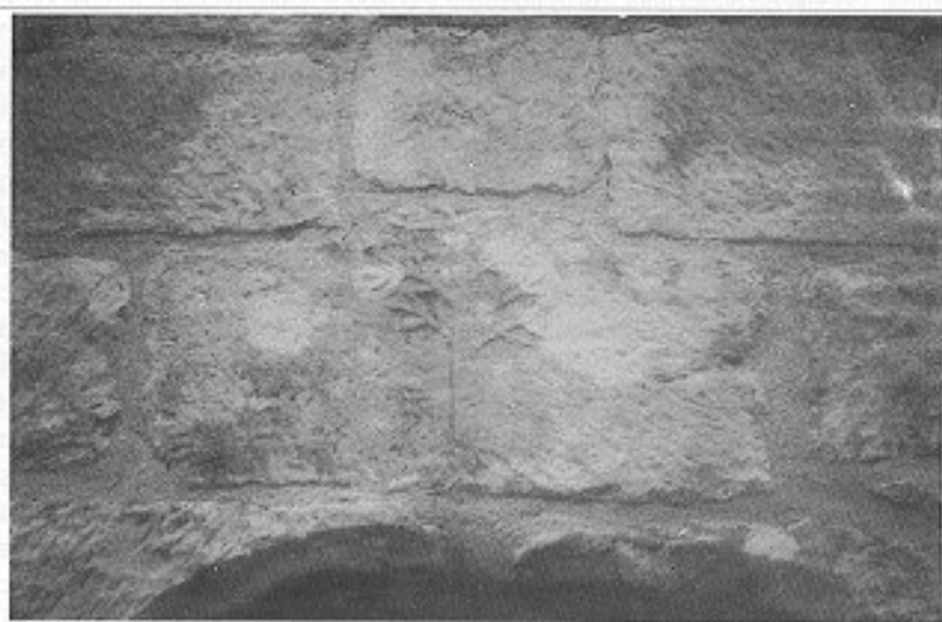
Ermita dels Sants.

Su población debía ser muy escasa y quizás resultado de los avances cristianos de la época de Alfonso I 'el Batallador', que incluso antes de conquistar Zaragoza había recuperado Morela. Hacia 1130 se repoblaron las tierras entre el Algás y el Matarraña y se llevó la frontera hasta Horta de Sant Joan y Gúdar, entre Gandesa y Valderrobres. La muerte de Alfonso I supuso un retroceso cristiano y la recuperación de aquellas tierras por parte de los musulmanes, que las conservaban en